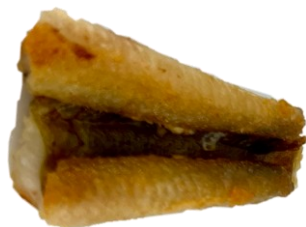
皮目中心とその両サイドに切れ込み有り