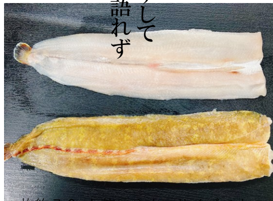
一枚約70gと使いやすいサイズです